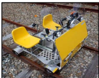
電動式軌道自動自転車